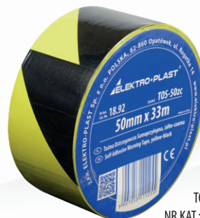
TOS-5zc NR KAT.: 18.92

TAŚMA OSTRZEGAWCZA SAMOPRZYLEPNA TOS-5bc, 5cm x 33m, biało-czerwona