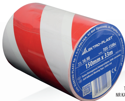
TOS-15bc NR KAT.: 18.98

TAŚMA OSTRZEGAWCZA SAMOPRZYLEPNA TOS-5zc, 5cm x 33m, żółto-czarna