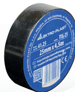
TIS-25 NR KAT.: 41.25