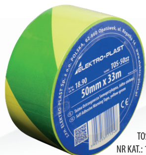
TOS-5zz NR KAT.: 18.90

TAŚMA OSTRZEGAWCZA SAMOPRZYLEPNA TOS-15zc, 15cm x 33m, żółto-czarna