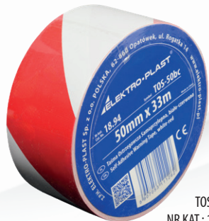
TOS-5bc NR KAT.: 18.94

TAŚMA OSTRZEGAWCZA SAMOPRZYLEPNA TOS-5bc, 5cm x 33m, biało-czerwona