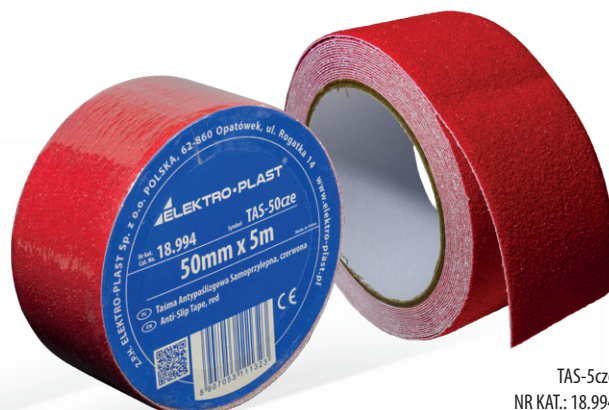
TAS-5cze NR KAT.: 18.994