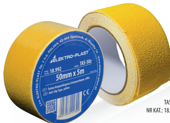
TAS-5z NR KAT.: 18.992