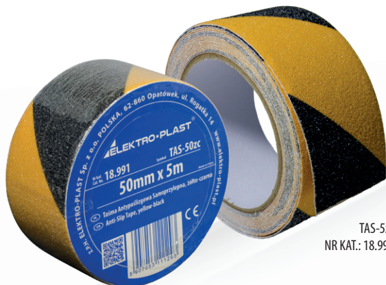
TAS-5zc NR KAT.: 18.991