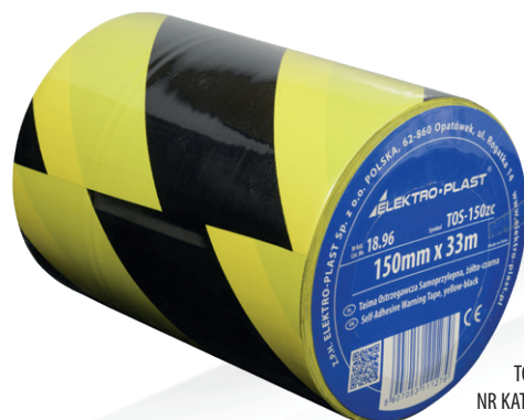
TOS-15zc NR KAT.: 18.96

TAŚMA OSTRZEGAWCZA SAMOPRZYLEPNA TOS-15bc, 15cm x 33m, biało-czerwona