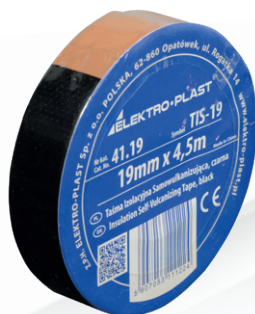
TIS-19 NR KAT.: 41.19