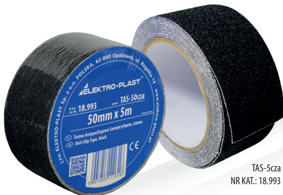
TAS-5cza NR KAT.: 18.993